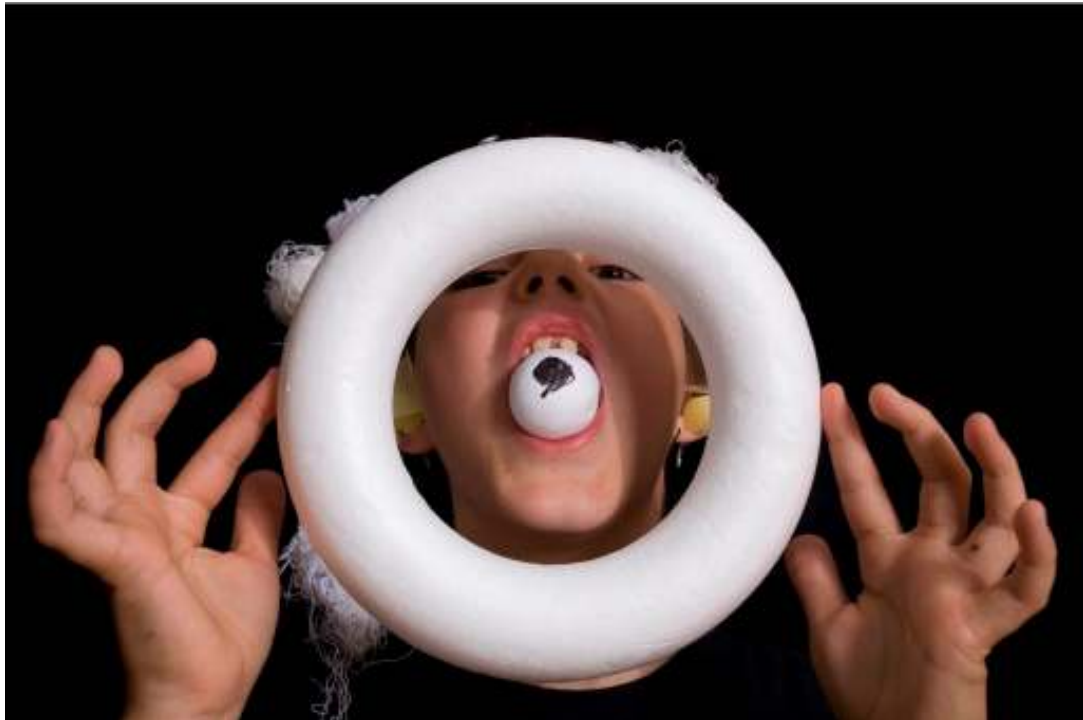
Camp musique